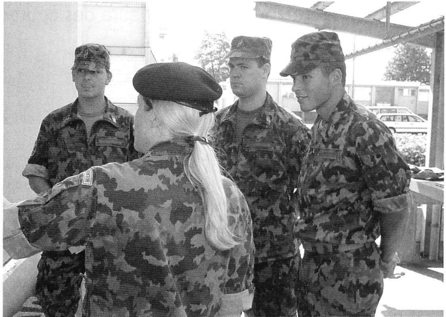
Dans des stages de formation de qualité, les officiers sont préparés à leurs fonctions.

3. La FSCA, reconnue dans et en dehors de l'armée comme lieu d'instruction pour les ca-