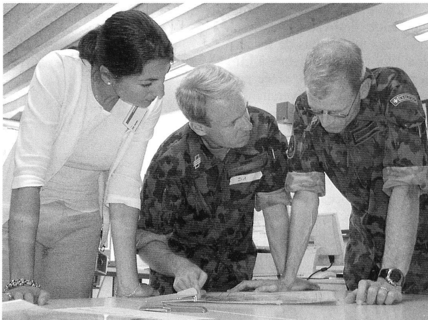
Des cadres d'entreprises sont aussi parties prenantes!

Durant la période 2004-2005, outre les stages de formation pour les cadres de l'armée et les cadres civils supérieurs du DDPS,