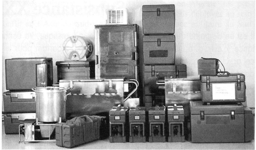
Equipement de cuisine.

Il ne faut pas oublier tout le matériel complémentaire pour l'exploitation et l'entretien de cette cuisine mobile. Ce matériel sera transporté, soit sur une remorque, soit dans un conteneur, (non encore décidé à ce jour).