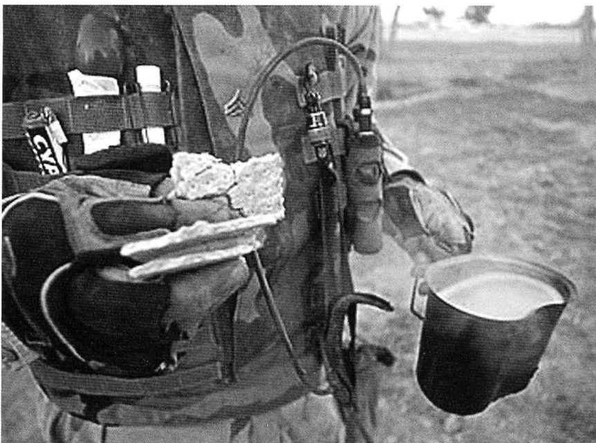
Soldat américain en Irak.

Surnommée parfois par les soldats américains Meal Refused by Ethiopians ou Meal Refusing to Exit , la ration MRE est composée de nourriture en sachets. Si certains renferment des aliments lyophilisés, la majorité de ces sachets contiennent de la nourriture prête à être consommée grâce à un nouveau