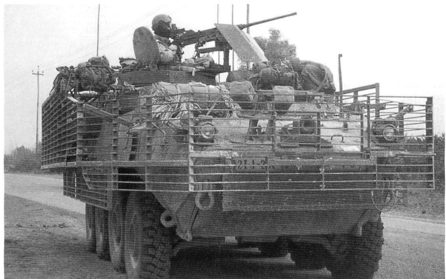
Un Stryder dans les rues de Bagdad. A remarquer les grilles anti-RPG-7.

combinaison entre dispersion et concentration, montrant la recherche d'un combat: