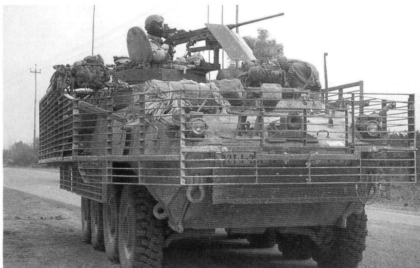
Un Stryder dans les rues de Bagdad. A remarquer les grilles anti-RPG-7.

combinaison entre dispersion et concentration, montrant la recherche d'un combat: