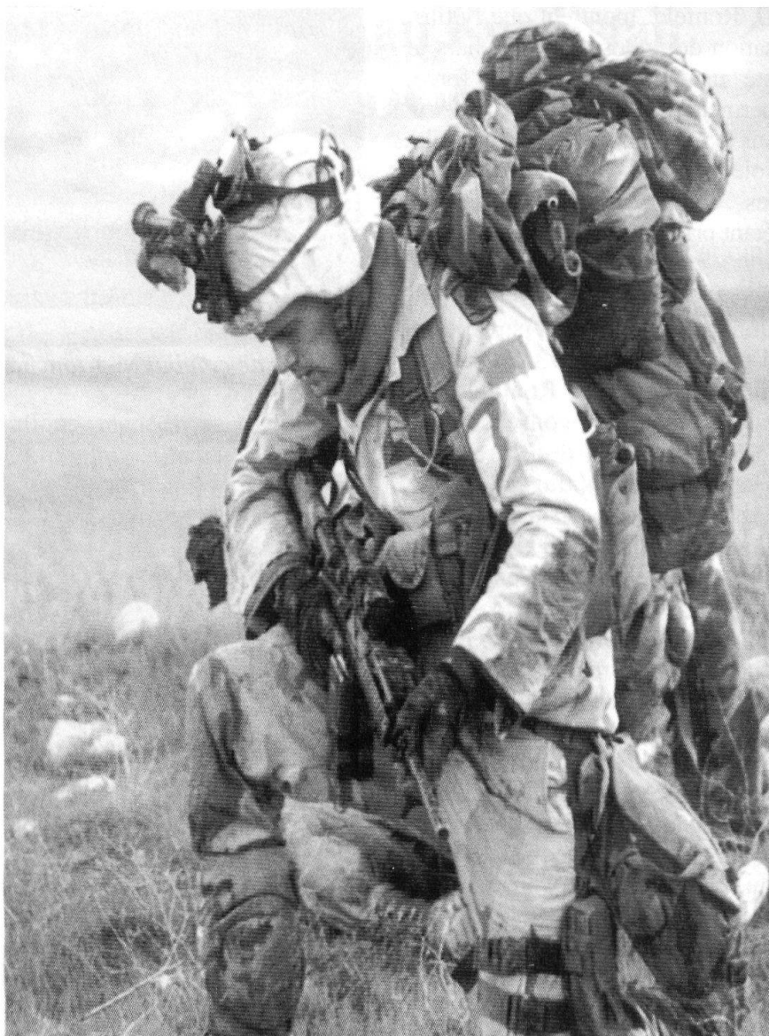
Un soldat américain des forces spéciales.

A Arnhem en 1944, «MARKET GARDEN» en a été un exemple à la fois majeur et tragique. Opération de large am-