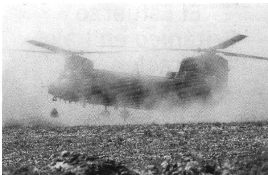
... et d'hélicoptères pour des mouvements moins longs. Même par tempête de sable.

Pratiquement, «AIRBORNE DRAGON» avait été planifiée depuis le Qatar aux premiers jours de mars, entre le commandement central (CENCTOM) et le commandement européen (EUCOM), dont dépendaient les forces qui allaient être employées. A ce stade, l'objectif recherché, à défaut de lancer une invasion de l'Irak par le Nord, était d'accélérer la chute du régime en lui enlevant toute possibilité de disposer d'une profondeur stratégique sur laquelle il aurait pu se baser pour mener un combat de retardement. Dans le même temps, les forces déployées devaient sécuriser les installations pétrolières de Kirkouk et prévenir d'éventuelles représailles irakiennes sur la population kurde. L'utilisation de troupes aéroportées semble avoir été envisagée. Toutefois, la 82 nd Airborne était alors basée au Koweït, de sorte que l'utilisation de la 173 e Brigade aéroportée a été rapidement évoquée. Unité intégrée au dispositif Sud de l'OTAN et basée à Vicenza (Italie), elle pouvait être activée dans les 96 heures.