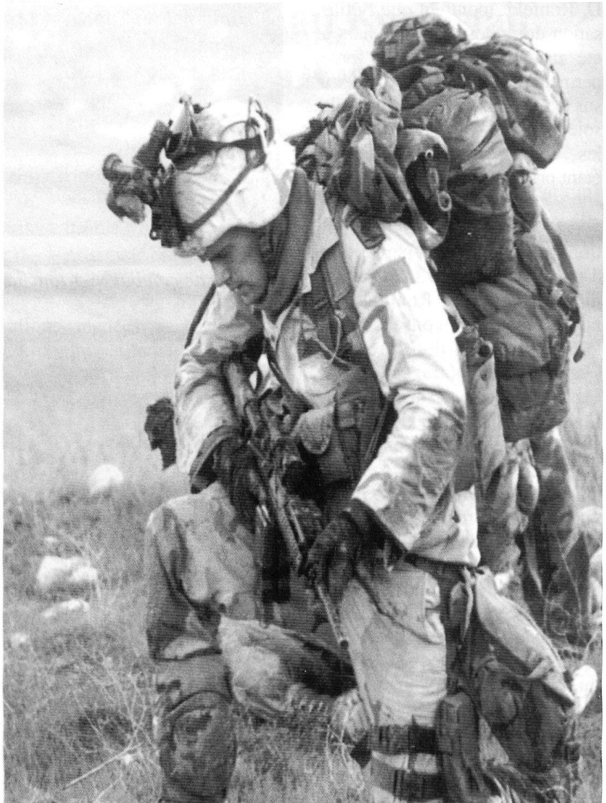
Un soldat américain des forces spéciales.

A Arnhem en 1944, «MARKET GARDEN» en a été un exemple à la fois majeur et tragique. Opération de large am-