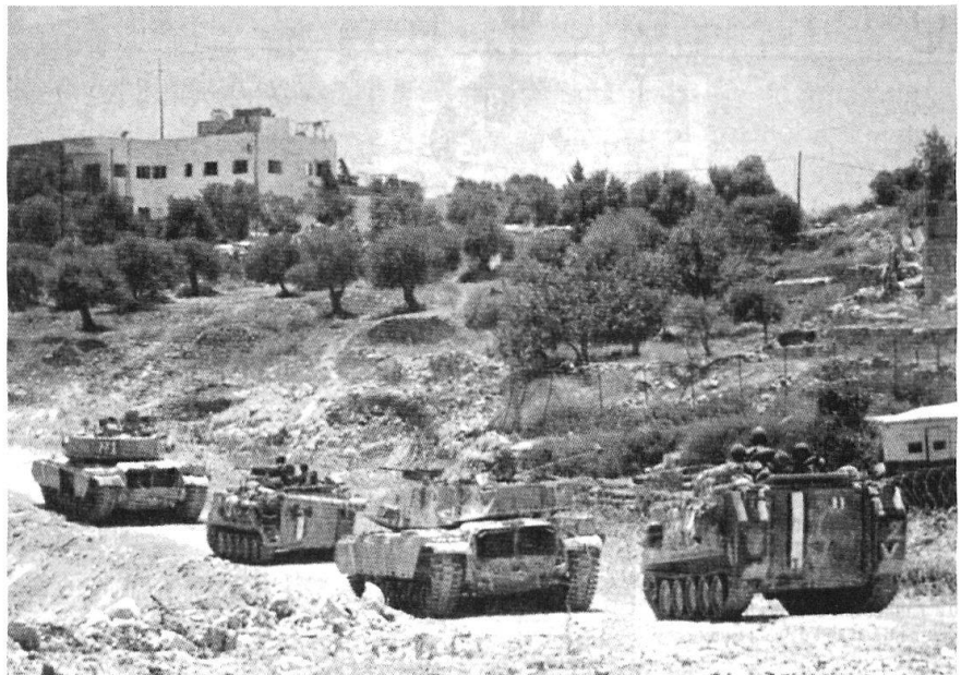
Plusieurs dizaines de chars et véhicules blindés ont pénétré à l'aube dans Ramallah.

Cette stratégie israélienne a fini par porter ses fruits: les Palestiniens connaissent aujourd'hui une infériorité physique, psychologique, éthique et co-