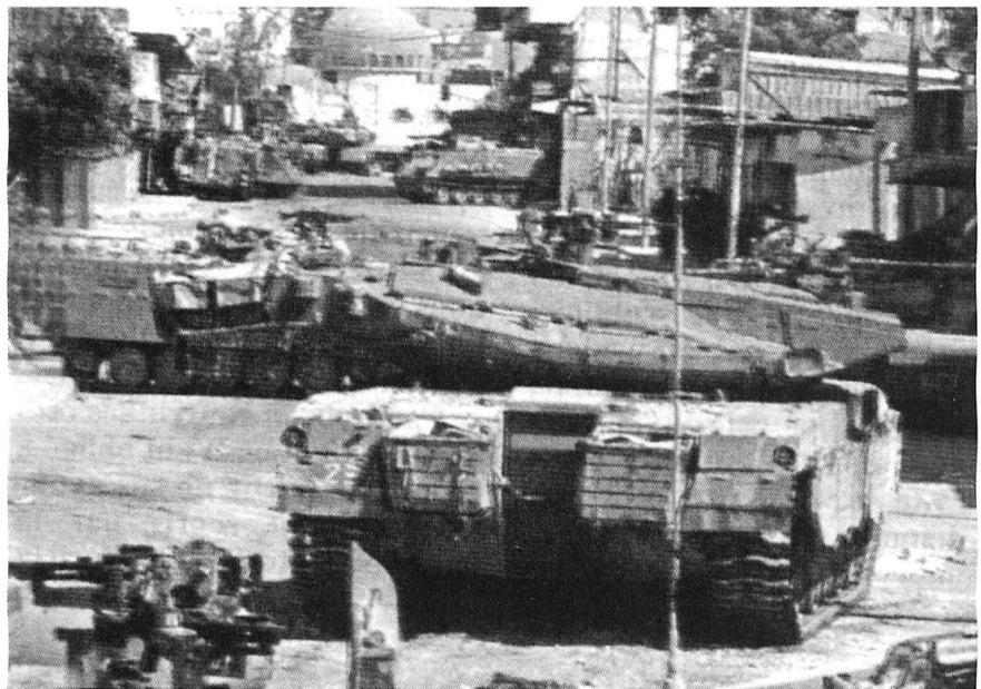
Les représailles après un attentat.

de. Conjugée à la suppression des primes versées par le régime de Saddam Hussein, elle a forcé les « bombes humaines » à se soucier des conséquences de leurs actes, provoquant ainsi la multiplication des redditions. Le troisième volet de la stratégie israélienne a consisté à exploiter la supériorité militaire et fi-