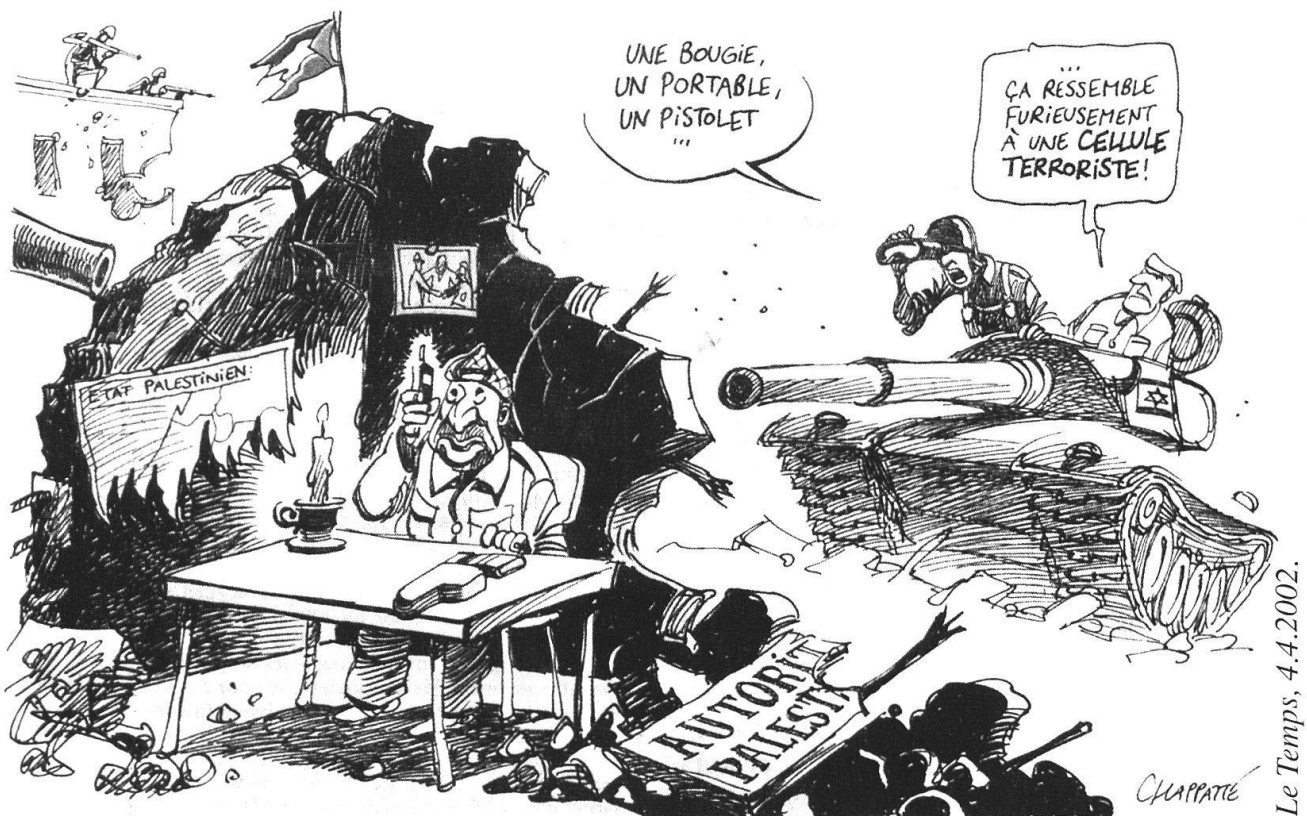
Les pressions s'accroissent sur Israël, y compris de la part de la Suisse. A Rome, le Vatican est intervenu directement auprès des principaux protagonistes du conflit pour leur demander de respecter les églises de Bethléem, où des Palestiniens ont trouvé refuge.