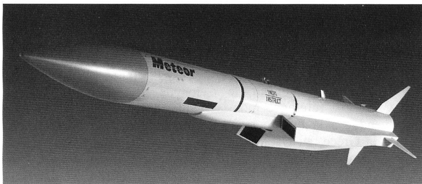
Missile air-air à moyenne portée Meteor.

De par son histoire, ses choix et ses ambitions, MBDA se démarque de la concurrence par la garantie offerte à ses partenaires de leur fournir un accès