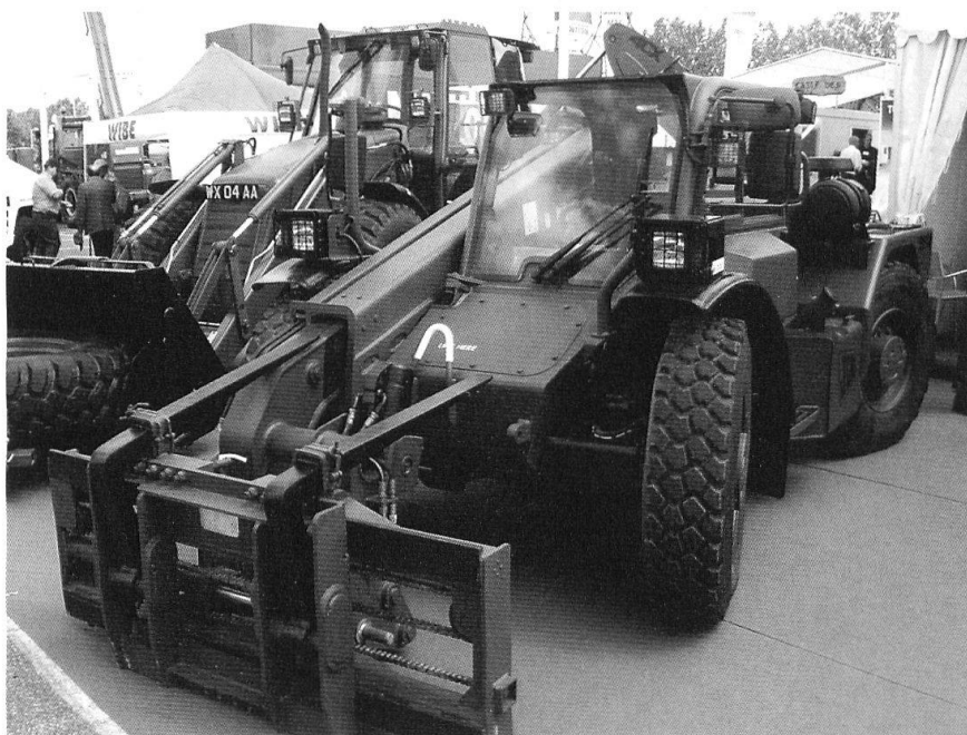
Une machine de chantier militarisée.

Parmi les seconds, le marché est actuellement disputé entre l'Allemand Kärcher et le Français SERT 1 . L'un comme l'autre proposent des modules bâtis sur des remorques, qui s'installent et sont prêts à l'exploitation en