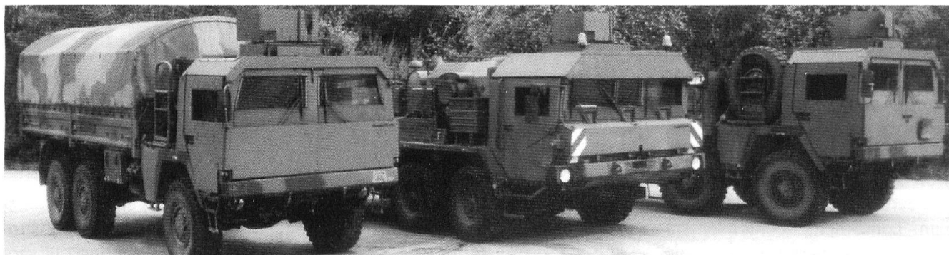
Des cabines blindées.

le linge, de cuisines roulantes, etc. Des roulottes spécialisées, également commercialisées dans le civil, permettent par ailleurs