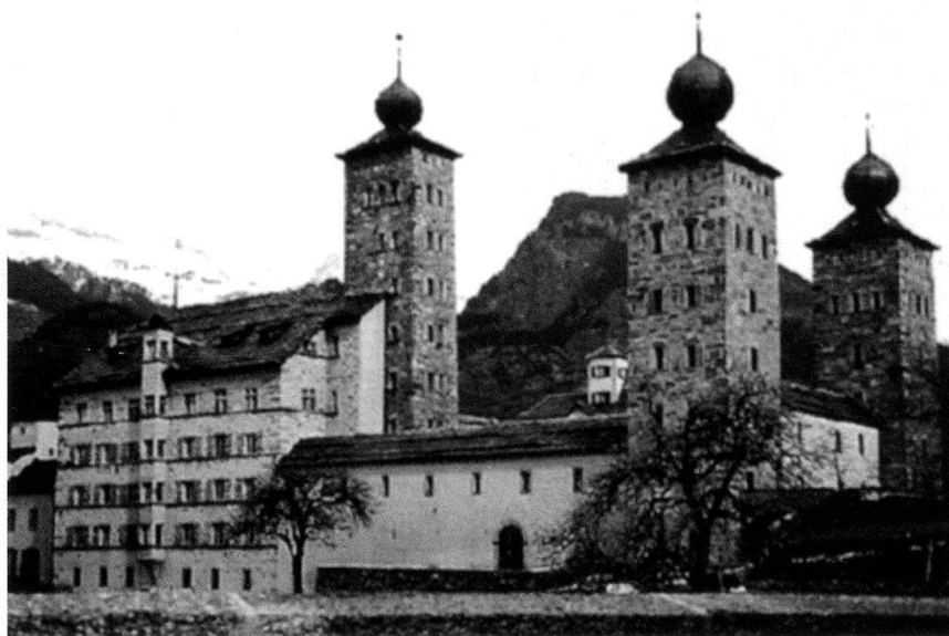
A Brigue, le château d'un entrepreneur militaire.

Selon le célèbre magazine Fortune , le département de la Défense américain aurait versé en 2003 au moins 30 milliards de dollars, soit 8% de son budget, à des sociétés militaires privées. Il en va de même en Europe, avec des contrats qui portent, aussi bien sur la maintenance de matériels que, dans le cas de la Grande-Bretagne, sur le ravitaillement en vol de ses avions de combat. La privatisation de la défense est donc un phénomène en pleine expansion, qui touche jusqu'aux fonctions régaliennes de l'Etat. Loin de rester cantonnées dans les «sales boulots» des guerres de la décolonisation, les compa-