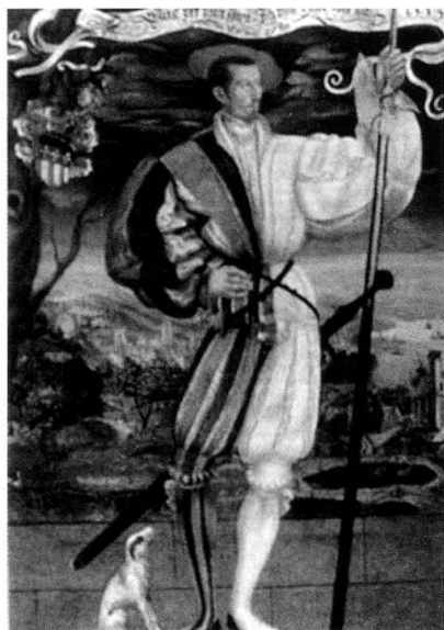
Un mercenaire de la Renaissance.