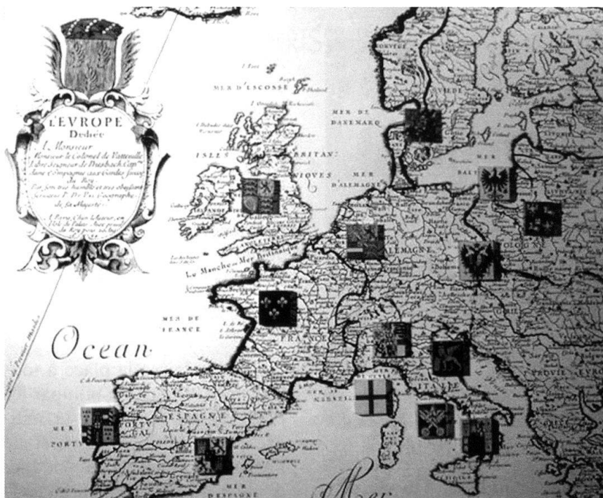
Sur cette carte, les drapeaux des Etats qui ont des capitulations avec les Louables cantons suisses.

Des traités particuliers, les capitulations militaires , règlent les questions de recrutement, de solde, de maintien des troupes, de la durée du service, des pensions, des effectifs, des congés, des nominations, des officiers, du secours réciproque en cas d'attaque par un tiers, d'uniforme et d'armement. Les capitulations sont conclues avec chaque Canton, puisque la force armée relève de leur seule autorité. Les cantons conservent tous leurs droits sur leurs ressortissants. On parle de troupes capitulées et non de mercenaires, lorsqu'on évoque les troupes suisses ayant servi en France ou dans tout autre pays ayant signé une convention. C'est là qu'il faut trouver la spécificité de l'«expérience suisse» et que l'on peut établir un parallèle avec les «compagnies militaires privées» actuelles.