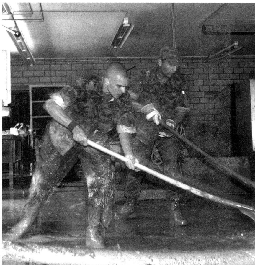
L'armée doit pouvoir faire face à une catastrophe naturelle...

En soi une situation normale en Suisse, pareille à aujourd'hui. Si ce n'est, depuis quelque temps, une guerre des clans qui fait rage entre deux groupes criminels avec plusieurs morts à Zurich et à Bâle. Sinon, rien à signaler. Contrairement au Nord de l'Italie qui est secoué depuis un certain temps par une série d'attentats sporadiques à l'explosif. Impossible jusqu'ici de