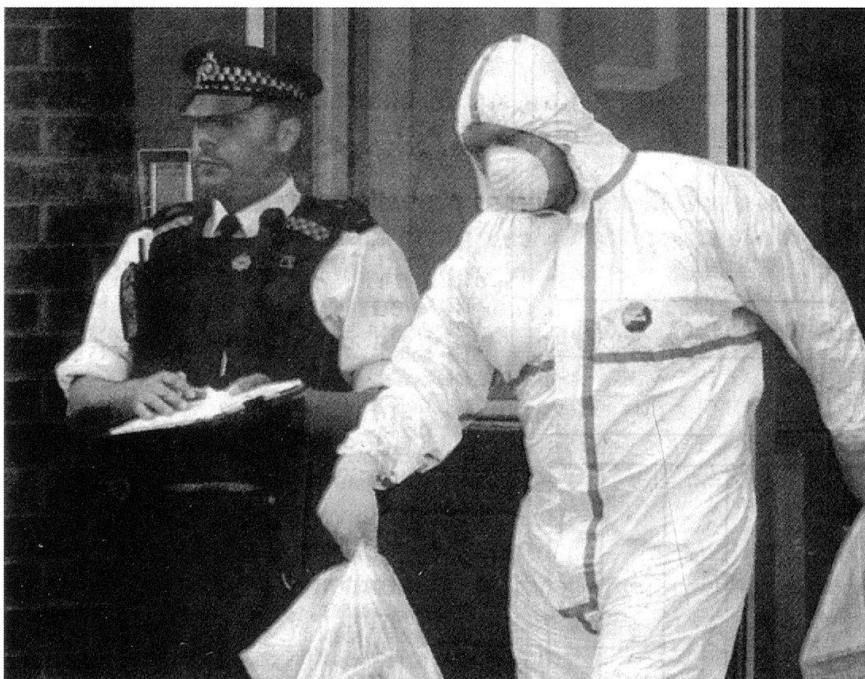
... et participer aux mesures anti-terroristes.

Le soldat qui monte la garde devant l'entrée d'un consulat, le logisticien de la Swisscoy au Kosovo, le médecin militaire en Afghanistan, le soldat d'infanterie qui protège une centrale de commandes d'un attentat, le pilote d'un F/A-18 qui s'entraîne à voler de nuit, au-dessus de la Norvège, tous ces militaires contribuent par leur engagement à la défense moderne du pays, aussi bien que le soldat de char et que le canonier d'artillerie qui entraînent, sur la place de tir, leur aptitude au combat interarmes. Il n'y a pas de missions de seconde zone. Il n'y a que des missions. Il n'y a qu'une armée, une armée de premier plan.