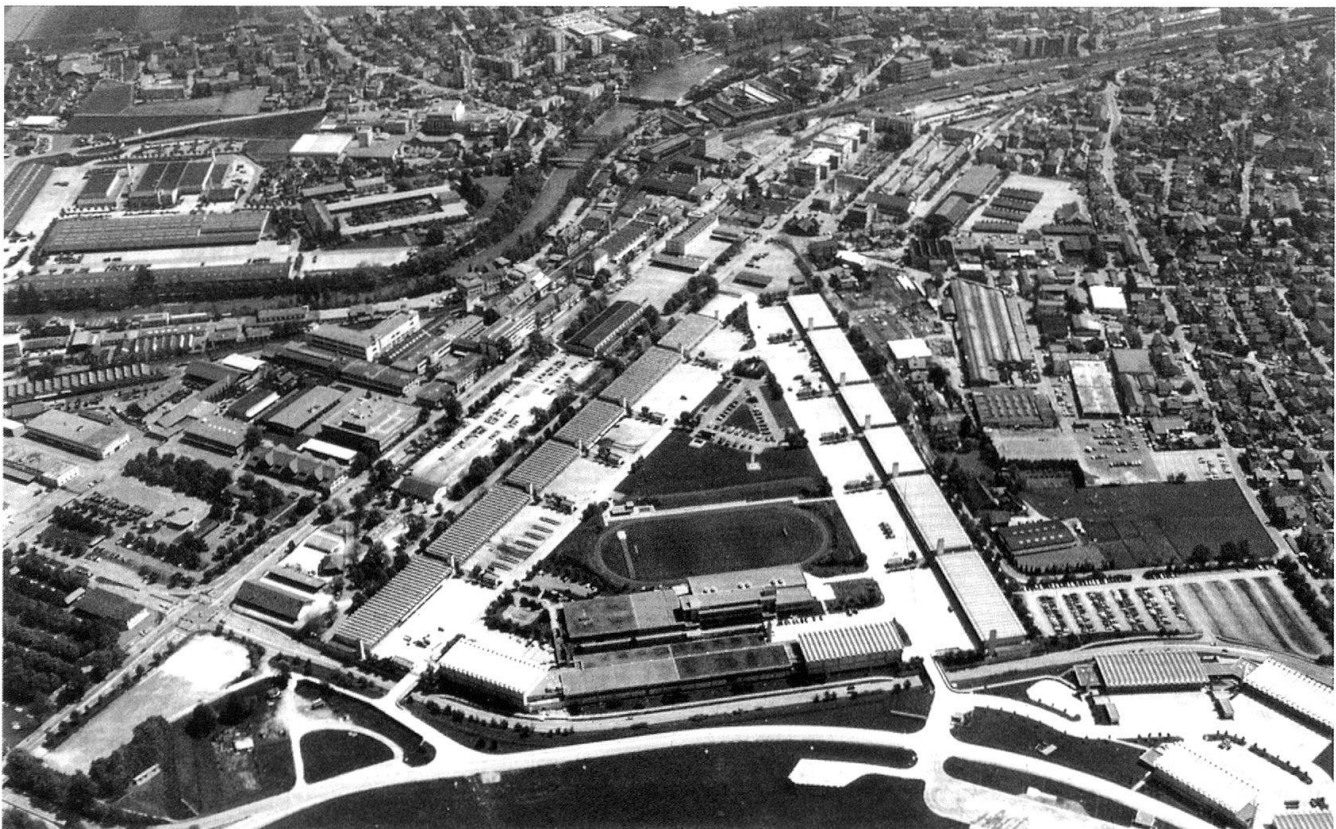
Le centre d'instruction des troupes mécanisées à Thoune.

Il y a beaucoup de travail à faire pour la politique en général et pour le Conseil fédéral et le Parlement en particulier. La Société suisse des officiers fera sa part!