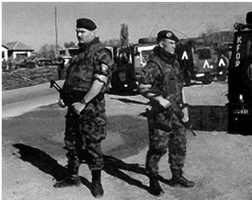
Des militaires suisses au Kosovo.

3. Le soldat suisse engagé en PSO est, dans nombreux cas, un miles protector , parce que ce