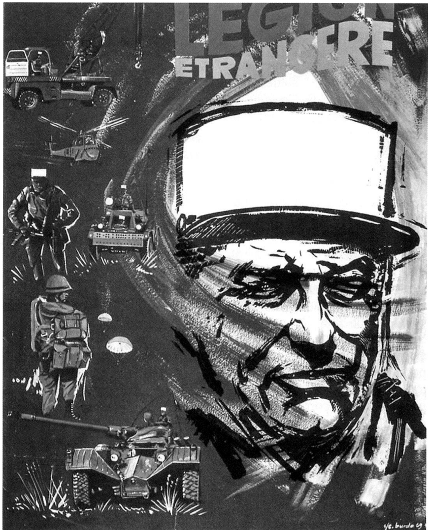
Plaquette de recrutement de la Légion étrangère très similaire à celle de l'Army National Guard.