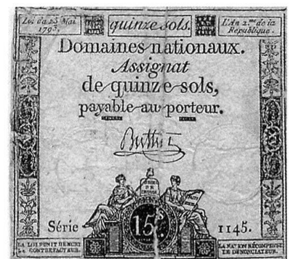
L'assignat, papier-monnaie assigné sur les biens nationaux, a servi à solder les troupes révolutionnaires...