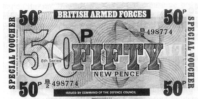
Grande-Bretagne (aujourd'hui): coupure de 50 pences ayant cours dans l'armée britannique. Cette monnaie n'est utilisable que dans les cantines militaires britanniques! (coll. V.Q.)

un cérémonial particulier: «Après avoir salué avec distinction et décliné son nom, son rang, son ancienneté, le légionnaire montre sa carte d'identité, puis avec un large geste de la main, il fait glisser sa solde dans son képi blanc 3 .»