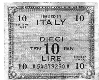
Italie 1943 : une coupure de 10 liras de 1943. On peut lire la valeur en italien et en anglais.

Dans la Légion étrangère, la remise de la solde, comme beaucoup d'autres événements propres à cette formation, revêt