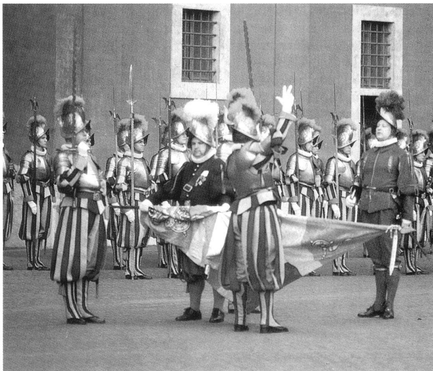
L'assermentation d'un nouveau garde.

Ce vendredi et les huit jours suivants composant les Noven-