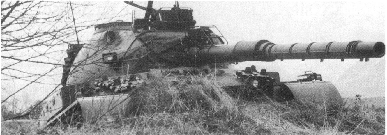
Un Char 68 en position d'aguet.

dans son métier et s'y sera perfectionné. Il suffira aux chefs de savoir l'utiliser pour réduire le temps nécessaire à l'introduction d'une innovation.»