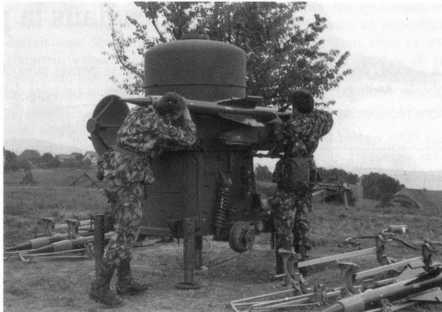
Mise en place d'un Rapier.