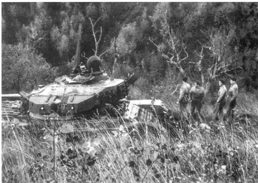
Un Centurion et son équipage.

Le combattant acquiert également des fonctions nouvelles sur le champ de bataille. Sa capacité de travailler de manière