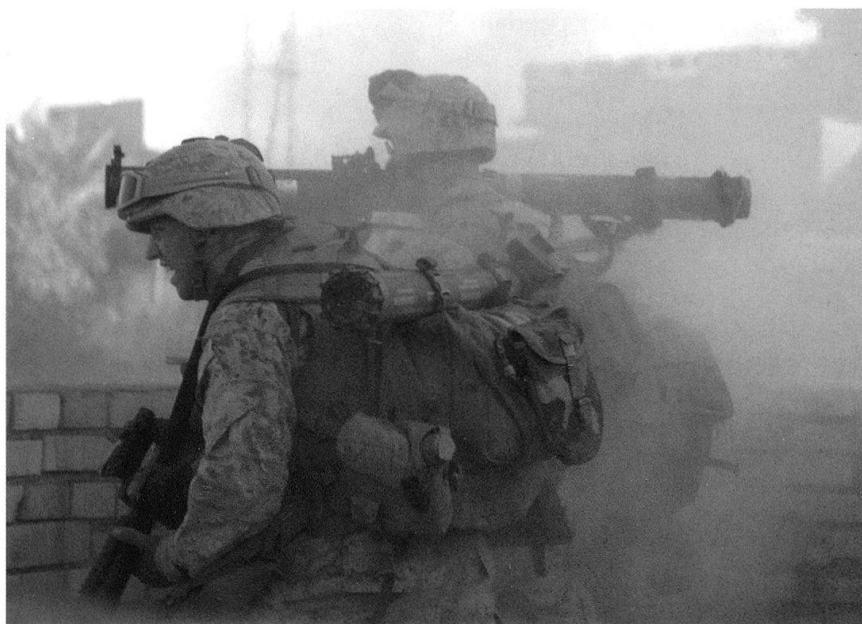
Soldats américains à l'engagement.

■ La formation du soldat américain, sa culture, qui se retrouve dans le code du soldat : «Je suis un guerrier et membre d'une équipe; je sers le peuple des Etats-Unis et vis selon les valeurs de l'armée. [...] Je me tiens prêt à me déployer, à engager [l'adversaire] et à détruire les ennemis des Etats-