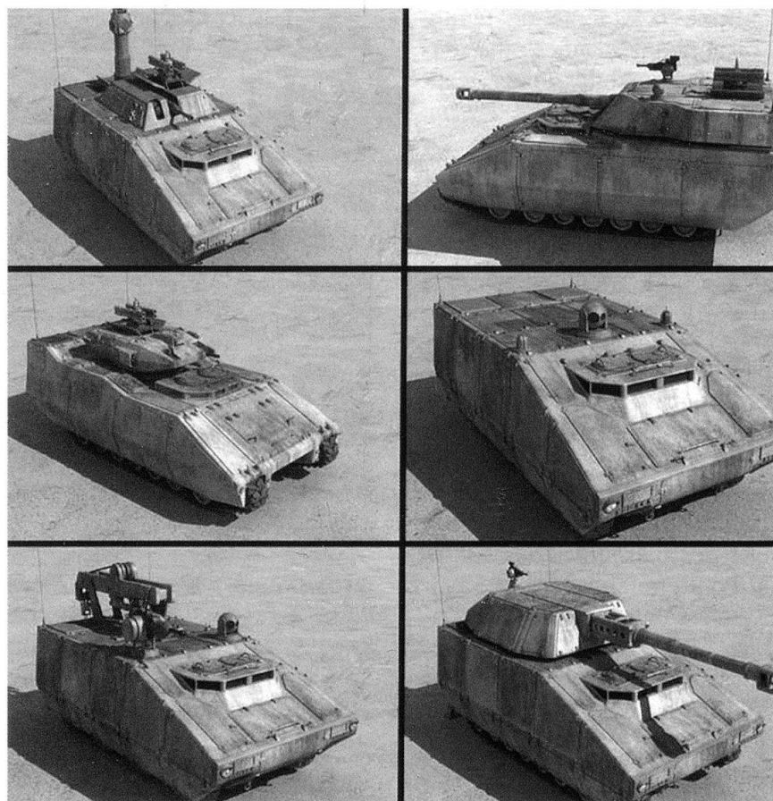
L'Army américaine axée sur la technologie et les matériels. Ici le Future Combat System.

Aussi brillante soit-elle, l'opération militaire du printemps 2003 a débouché sur un conflit interne à l'issue incertaine entre les différentes communautés irakiennes. Les Etats-Unis se trouvent désormais contraints de maintenir une présence coûteuse humainement, politiquement et financièrement (environ 5 milliards de dollars par mois toutes dépenses confondues). Même si aux Etats-Unis le soutien de l'opinion publique à la politique menée en Irak fléchit, un rapide retrait des troupes américaines reste peu probable.