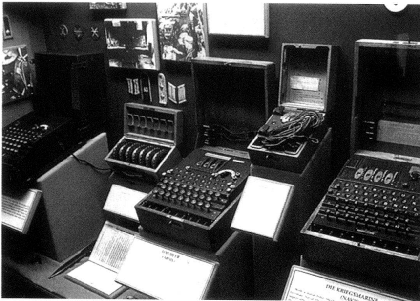
Le système Enigma.

intense. Les deux communautés ont leur caractère propre et des particularités qui font qu'elles sont peu en phase avec les relations politiques entre les deux Etats. Les services de renseignements gardent traditionnellement les secrets qu'ils découvrent, ils les exploitent sans les partager. Jusqu'en 1945, les autorités civiles et militaires américaines ne connaissent pas les succès britanniques touchant à Enigma et les décryptages des messages radio de la Police d'ordre allemande; elles ne reçoivent que quelques documents de synthèse émis par les Britanniques. En revanche, elles disposent de l'enregistrement des conversations entre prisonniers allemands. L'ambassade américaine à Berlin prévoit, à fin octobre 1941, que tous les juifs d'Allemagne seront déportés «en l'espace de quelques mois», ajoutant à la mi-novembre, que les individus valides sont transférés d'Allemagne en Russie comme travailleurs for-