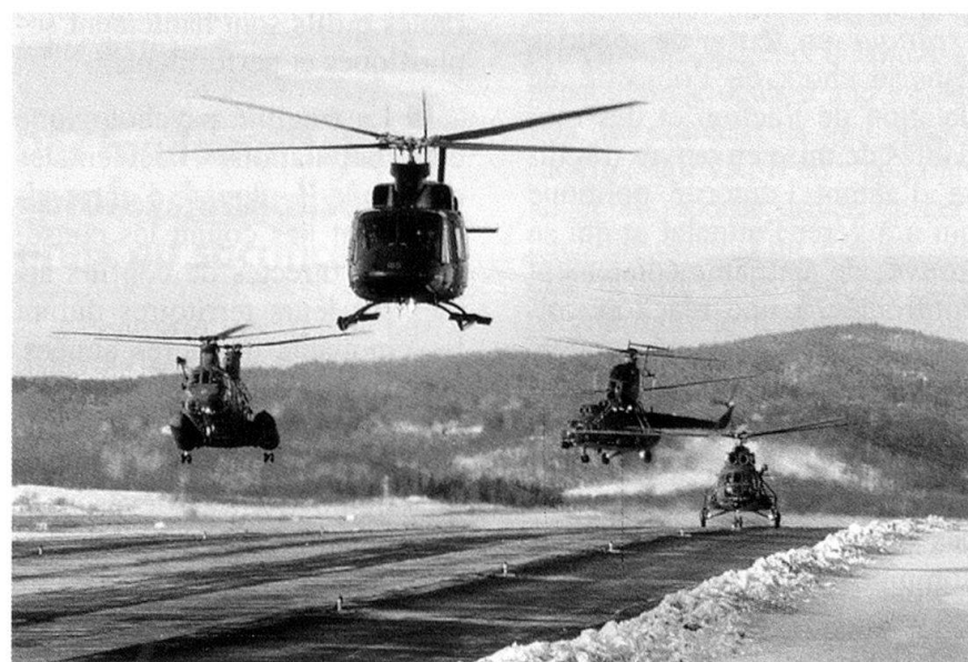
Départ de forces spéciales.

entraîner hors des frontières : les actions coercitives qui, même si elles sont exécutées dans le cadre du mandat obtenu par une force de maintien de la paix, reposent, au niveau tactique, sur un savoir-faire identique à celui nécessaire pour la sûreté sectorielle et la défense. C'est particulièrement le cas des forces spéciales qui, durant tout l'exercice, ont dû mener des missions à haut risque sur des objectifs d'importance opérative (reconnaissances spéciales dans la profondeur, actions directes sur des postes de commandement, captures de criminels de guerre, libération de militaires pris en otages, etc.). En d'autres termes, une participation helvétique accrue sert directement le développement de la compétence-clef de l'armée.