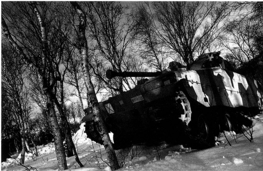
Un CV-902 suédois.

troupes: si les formations tactiques étaient déployées dans le grand Nord, les états-majors de la Force multinationale et de ses composantes étaient situés dans la forteresse de Stavanger, qui abrite à la fois le quartier-général interforces des Forces armées norvégiennes et le Joint Warfare Center de l'OTAN, environ 1200 km plus au Sud. Cet éloignement géographique n'a d'ailleurs pas été sans provoquer quelques décalages entre les états-majors travaillant dans l'atmosphère climatisée d'un poste de commandement moderne, à raison de deux relèves (jour et nuit) quotidiennes, et des troupes confrontées en permanence à des températures pouvant descendre jusqu'à -24^{\circ}\text{C} en plein jour!