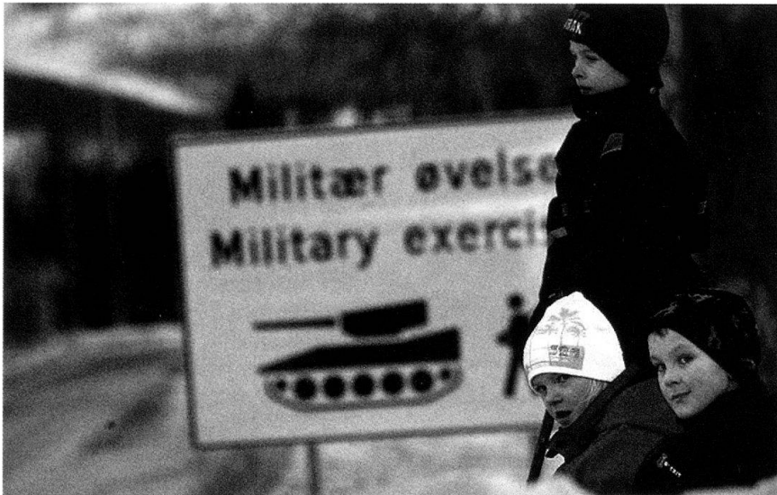
L'exercice a lieu dans les zones habitées.

le contrôle de l'espace aérien avec des F-16 norvégiens, y compris pour des frappes ciblées avec un guidage terminal au sol. Enfin, la composante terrestre a bien effectué des manœuvres importantes, dans un terrain très difficile, avec parfois un risque d'avalanche réduisant les mouvements, afin de s'emparer des objectifs devant être tenus pour contrôler le secteur d'engagement et progressivement entraver les éléments paramilitaires adverses.