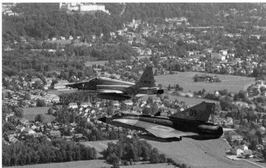
Vol de convoyage des F-5, escortés par des Draken.

Les Draken connaissent l'épreuve du feu durant le conflit des Balkans. Le 28 juin 1991, un Mig-21