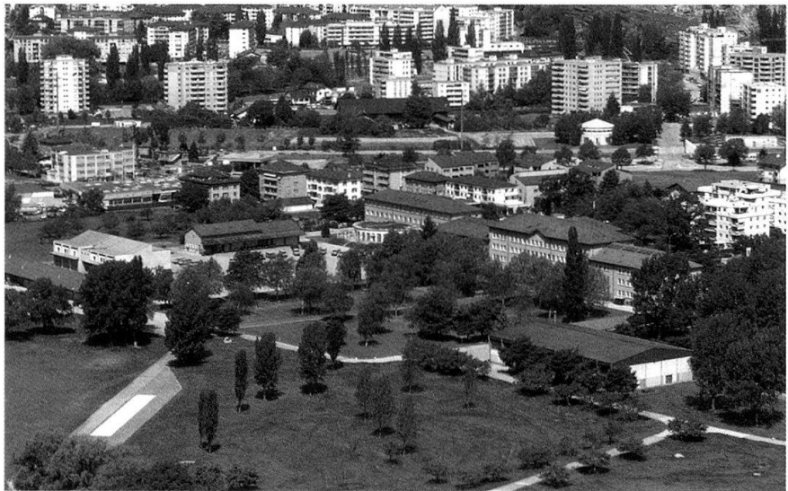
Place d'armes de Sion

Au cœur du Valais central et aux portes du centre-ville, la place d'armes de Sion s'étend sur environ 39 ha. Les troupes de l'artillerie tractée l'ont occupé pendant de nombreuses années, avant de céder la place aux troupes de forteresse, avec l'introduction d'Armée 95. Les troupes de forteresse y sont restées jusqu'à la fin 2002. Ce n'est qu'en 2003 que les premiers éléments de l'actuel Stage de formation sof sup sont venus occuper la place d'armes de Sion.