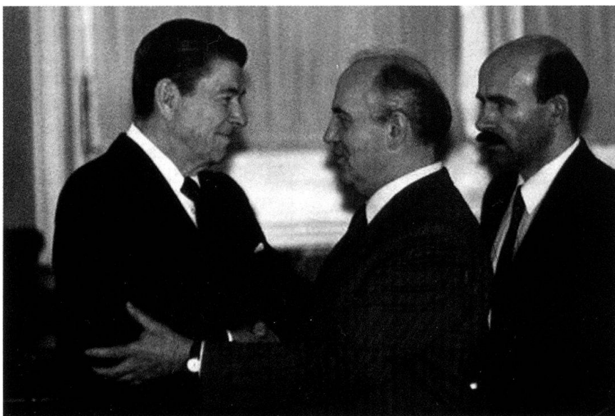
MM. Reagan et Gorbatchev.

Gorbatchev est sans doute sincère en voulant œuvrer pour une limitation des armements nucléaires, mais pas par la méthode radicale qu'il annonce le 15 janvier 1986, le désarmement total jusqu'à l'an 2000. Preuve en est qu'il signe le 31 juillet 1991, avec le président Bush père, le traité START I qui abaisse les panoplies des deux Grands à respectivement 6000