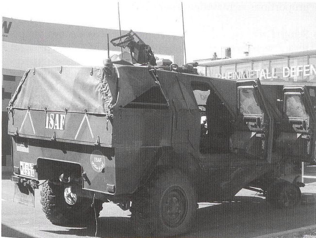
Un Dingo légèrement blindé de la Bundeswehr, touché par une mine en Afghanistan

L'Armée de terre se retrouve le parent pauvre de la Défense nationale. Certes, il n'y a là rien de nouveau, si ce n'est qu'elle se voit désormais assigner des «travaux d'intérêt général», pour reprendre une expression si typiquement militaire. Ces corvées vont de la dépollution des plages au ramassage scolaire, lorsque les rivières débordent, en passant par le tronçonnage des arbres après la tempête, la collecte des poubelles dans les villes touchées par des mouvements syndicaux, la garde des dépôts d'euros, les plans VIGIPIRATE successifs, etc. Autant de missions qui l'éloignent de sa vocation strictement militaire et qui, en outre, compliquent fortement le recrutement. Difficile de vendre efficacement une profession dont l'essence reste le combat avec de telles perspectives d'emploi. (...)