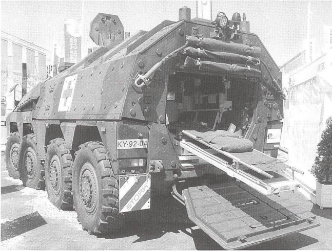
Boxer vu de l'extérieur.

On observe des évolutions parallèles face à la souffrance. La pharmacopée permet maintenant de lutter efficacement contre la douleur. L'objectif est de la supprimer. La souffrance n'est plus considérée comme pouvant avoir une valeur et est largement fuie. De ce fait, la sensibilité des opinions publiques occidentales face aux souffrances provoquées par les guerres, civiles ou nationales, et par les différentes armes tend à se manifester plus nettement.