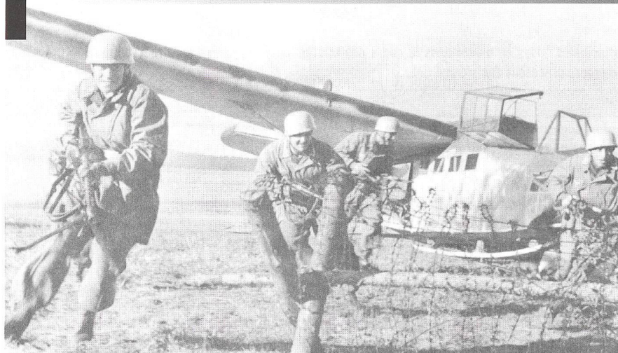
Des parachutistes allemands bondissent d'un planeur d'assaut DFS 230 (ici à l'entraînement, en Pologne), équipés d'armes automatiques et de charges creuses. Leur but est de neutraliser le fort belge d'Eben Emaël.