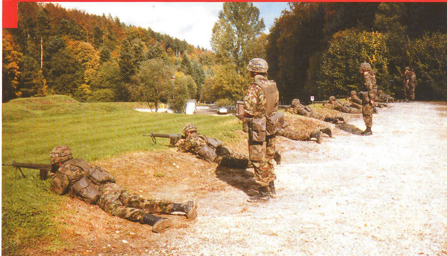
Instruction au tir, place d'armes de Bure (JU)