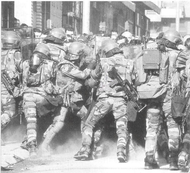
Les actions en zone urbaine peuvent tenir du combat, du maintien de l'ordre comme ici à Mitrovica en 2000, ou être de nature subsidiaire ou d'assistance humanitaire.