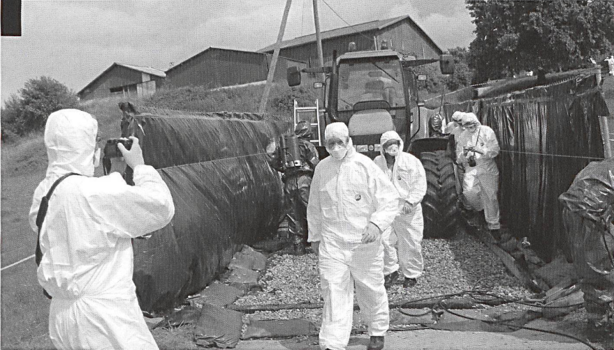
Autoluve monté par une formation d'intervention en cas de catastrophe.