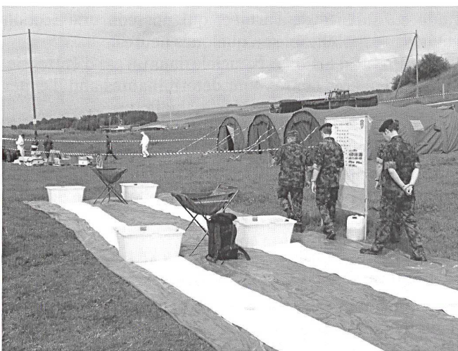
Zone/parcours de décontamination NBC.