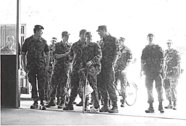
Effervescence à Moudon pour l'organisation d'une journée portes ouvertes.

La troupe a bien joué le jeu, chaque poste a été présenté avec plaisir et interactivité. Montage, démontage des armes, matériel de cuisine de campagne, radio SE-430, SE-235 ou encore RITM avec possibilité d'essayer les appareils. L'intérêt des visiteurs était bien présent !