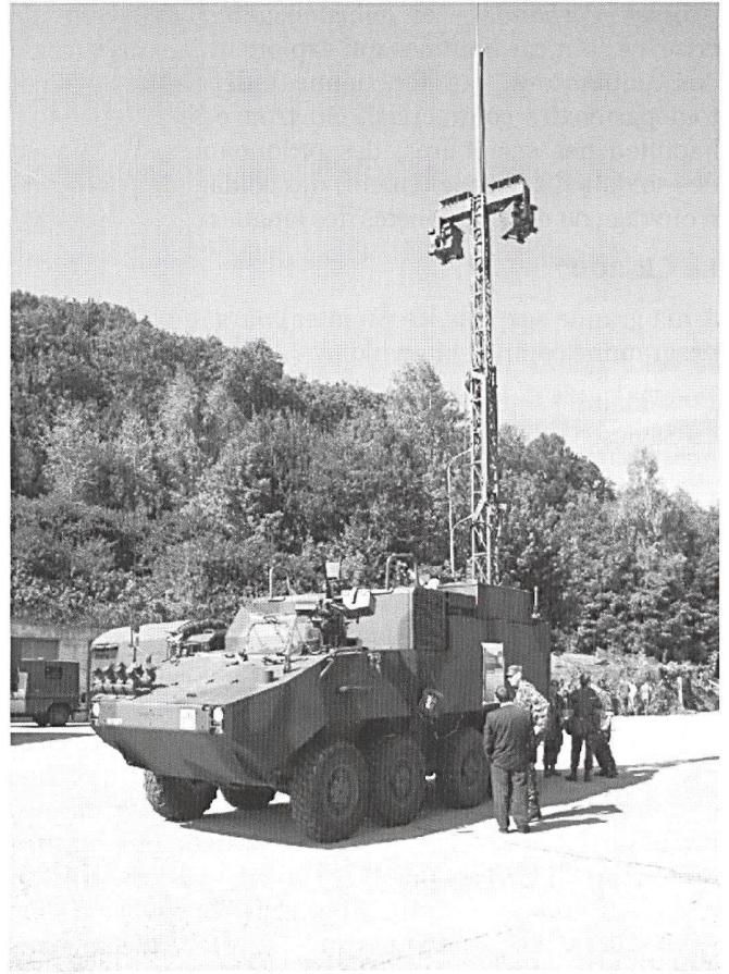
Lors d'engagement mobiles, ou pour renforcer les concentrations fixes, le RAP-Panzer est engagé.

Démonstration des équipements de la salle de conduite (TOC) d'une Grande Unité.