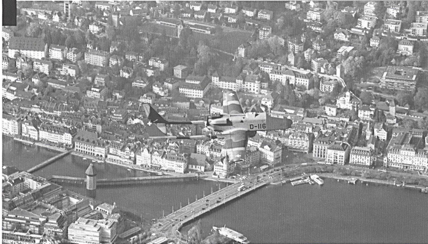
ADS 95 survolant Lucerne