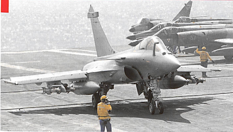
Le Rafale (gauche) et le Super Hornet (ci-dessous) répondent aux exigences d'appareils multi-rôles embarqués.