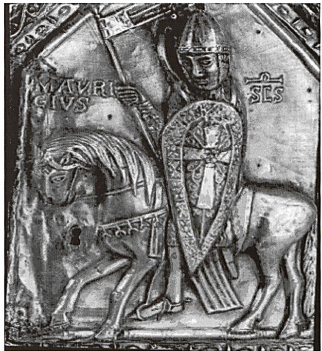
Représentations de Saint Maurice, en Afrique et en Europe médiévale.