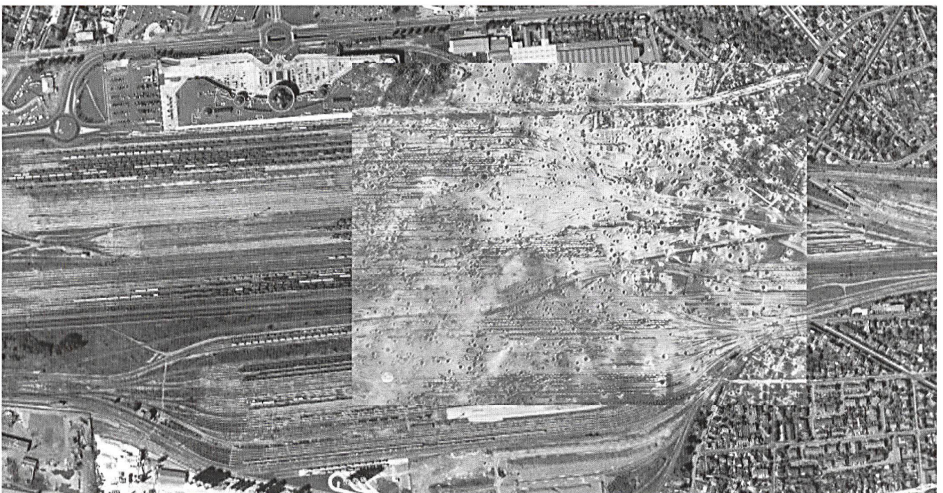
La gare de triage de Vaires sur Marne en avril 1944 et aujourd'hui

Philippe BAUDUIN, Normandie 1944. Quand l'or noir coulait à flots . Damigny, Heimdal, 2004.