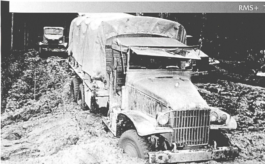
Difficultés de circulation sur la «Red Ball Express».