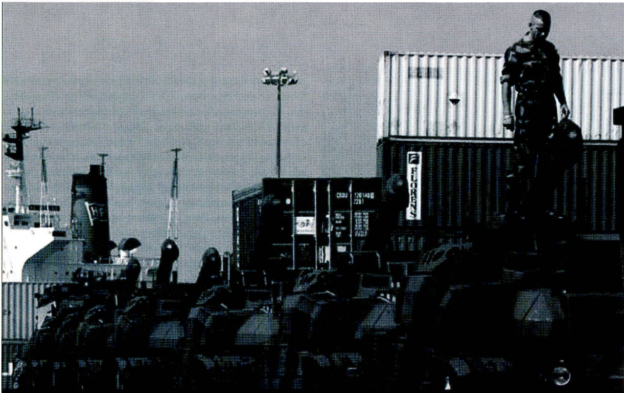
Chars d'assaut français Leclerc dans le port de Beyrouth pour la troupe renforcée de maintien de la paix de l'ONU au Liban sud.

ditions a été régulièrement apportée. Chars de combat et chars de grenadiers aptes au combat sont aussi indispensables comme moyen de protection de ses propres unités et comme «show of force». Prenons, par exemple, l'approche actuelle de l'armée française pour déployer des moyens au Liban. Avec le renforcement de l'engagement français pour l'ONU au Liban, ce sont déjà quatorze chars de combat du type Leclerc qui ont été jusqu'ici envoyés dans la zone en crise, apportant clairement la preuve du sérieux des troupes des Nations Unies sous commandement français.