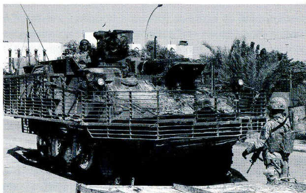
Véhicule de combat Stryker en Irak, avec sa «cage», censée faire exploser prématurément les projectiles à charges creuses.

prématurément les projectiles à charges creuses avant qu'ils n'atteignent le blindage proprement dit. L'alourdissement de plusieurs tonnes et l'augmentation de l'encombrement dus à la grille métallique ont cependant pour conséquence une diminution de la mobilité du véhicule.