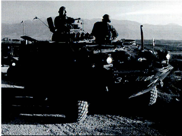
Le moyen d'intervention le mieux protégé et le plus apte au combat de la Swisscoy au Kosovo: le Piranha.

ses propres intérêts et sa liberté d'action et de pouvoir continuer à s'acquitter de sa mission (adaptée en conséquence).