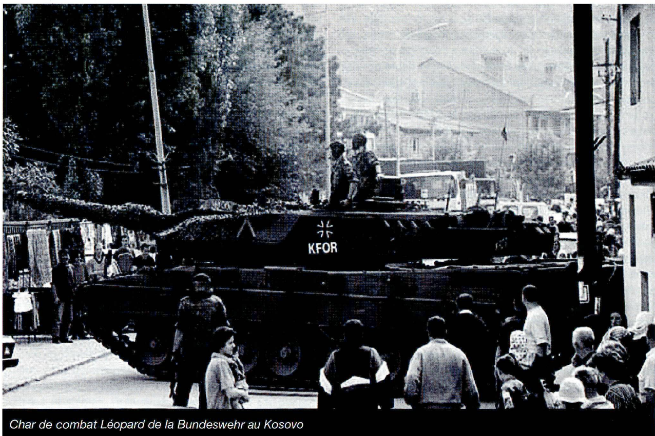
Char de combat Léopard de la Bundeswehr au Kosovo

Dans cet environnement, le bazooka, la mine, la mitrailleuse et les charges explosives improvisées constituent encore une menace réelle, l'embuscade, l'attentat avec mise à feu télécommandée et les kamikazes qui se font sauter avec leur charge explosive constituant les formes d'intervention de l'adversaire. L'initiative reste ainsi au franc-tireur, relativement faiblement armé, et la troupe, militairement organisée et équipée, doit chercher à survivre au premier affrontement par des opérations de reconnaissance et une protection ba-