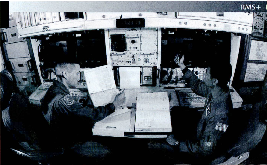
Offensives durant la guerre froide, les armes stratégiques prennent désormais un tournant défensif lorsqu'il s'agit de protéger le territoire des risques d'attaques terroristes. Ici, un centre de contrôle de missile intercontinental (ICBM) MX américain.