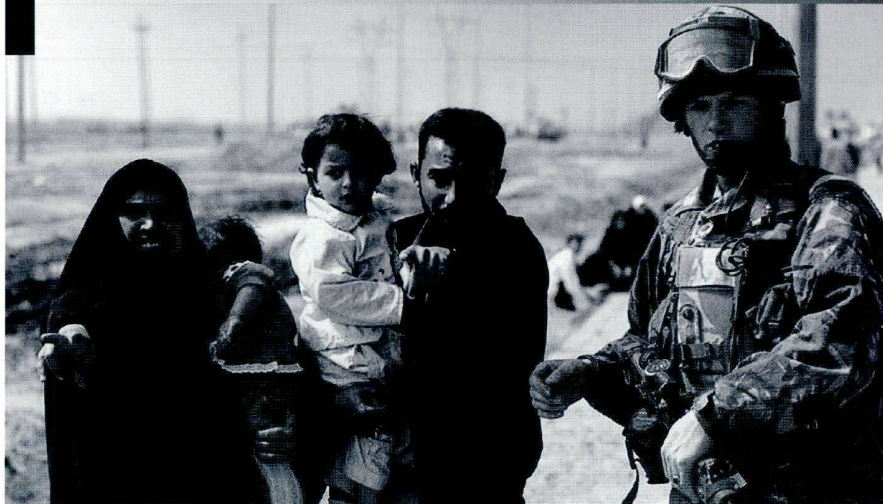
L'intégration de réseaux terroristes nationaux pose de nombreux problèmes à l'intervention internationale.