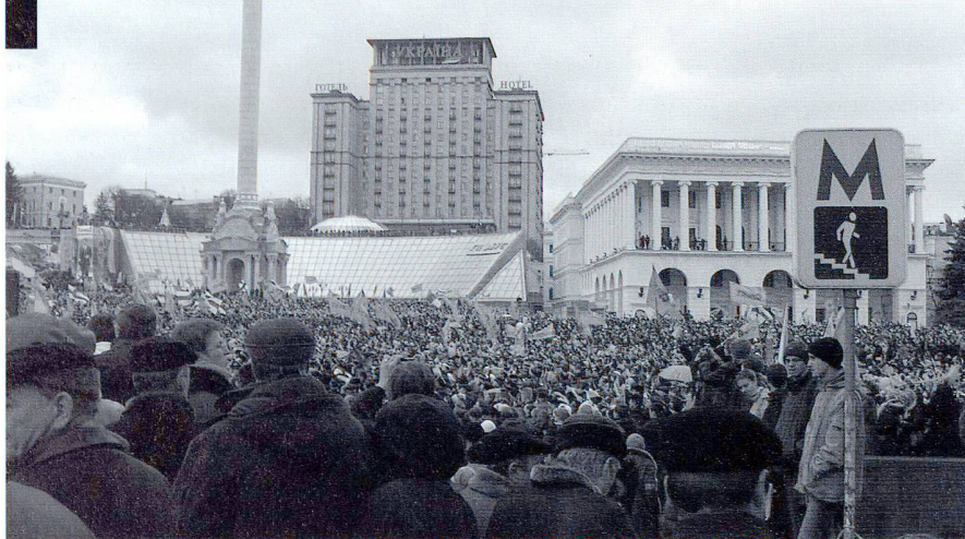
Révolution «Orange» en Ukraine, 2004. Les manifestants mettent en question le vote présidentiel.