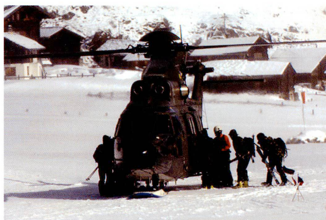
L'organisation d'un tel événement dépend du transport aérien, des transmissions et de l'infrastructure sanitaire militaire.

Le départ des concurrentes et concurrents, à Zermatt, a lieu dans un décor des plus impressionnants. Tout le village assiste au passage des patrouilleurs sur les premiers kilomètres en direction de Stafel. Les 1000 premiers mètres de dénivellation sont généralement parcourus à pied, les skis attachés au sac de montagne. Arrivés à Stafel, les patrouilleurs chaussent leurs skis et suivent le tronçon, relativement plat, qui les conduit au poste de Schönbiel. À partir d'ici, le parcours devient très pentu par-dessus la partie appelée Stockji-Mauer, et ceci jusqu'au point culminant de l'itinéraire, la Tête-Blanche (le poste se situant à 3650 m au dessus de la mer). Pour des questions de sécurité, les patrouilles forment des cordées. Elles restent également encordées pour la