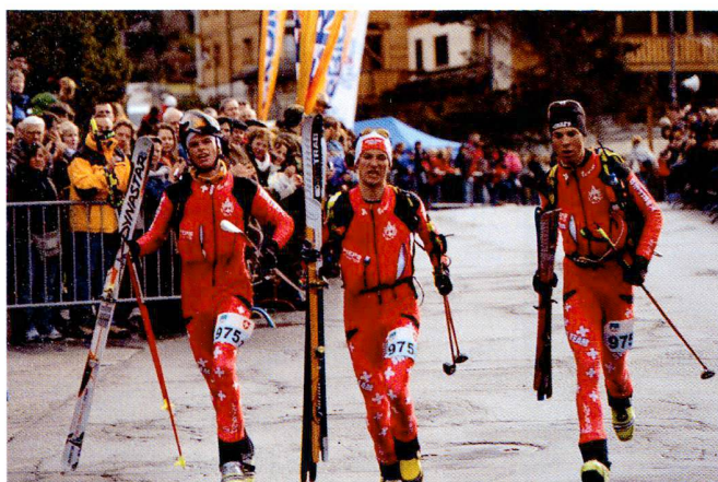
Arrivée des premières patrouilles à Verbier.

Parcours A : Zermatt – Verbier (longueur: 53 km, dénivelé +3994 m / - 4090 m, kilomètres effort 110)