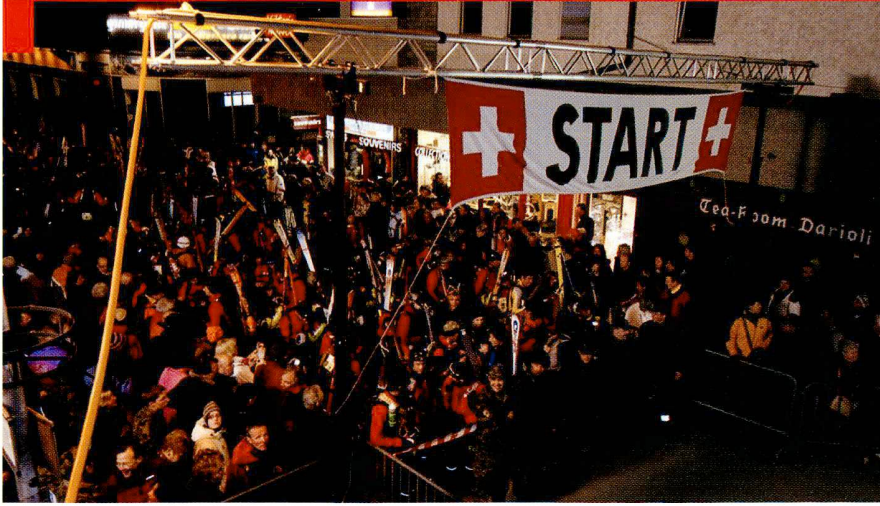
Le départ a lieu à Zermatt et Arolla.