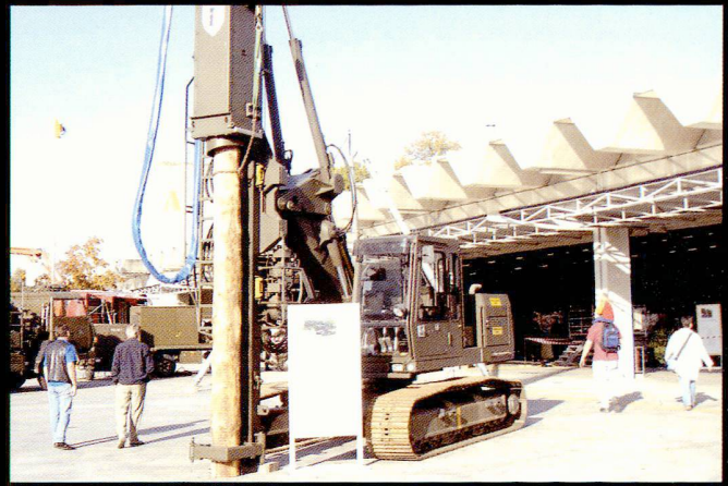
Les compagnies techniques mettent en œuvre des engins de chantier à roue ou à chenille.