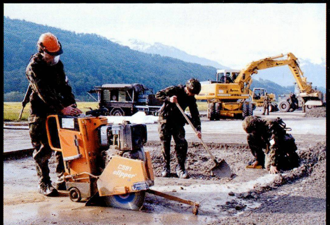
De nombreux travaux sont effectués à la main, notamment au sein des compagnies de sapeurs d'aérodrome.