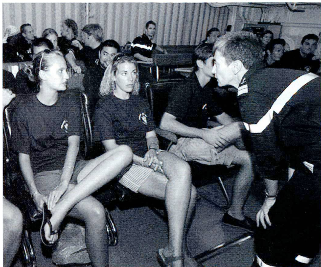
Accueil des otages libérés à bord de navires de guerre français.

eux serait même tombé à l'eau. A cet instant, la capacité militaire dans la zone permettent, sur le plan qualitatif comme quantitatif, de prendre d'assaut le navire pour libérer les otages. Mais le nombre de ceux-ci et les risques inhérents à une plate-forme maritime rendent cette option peu attrayante.