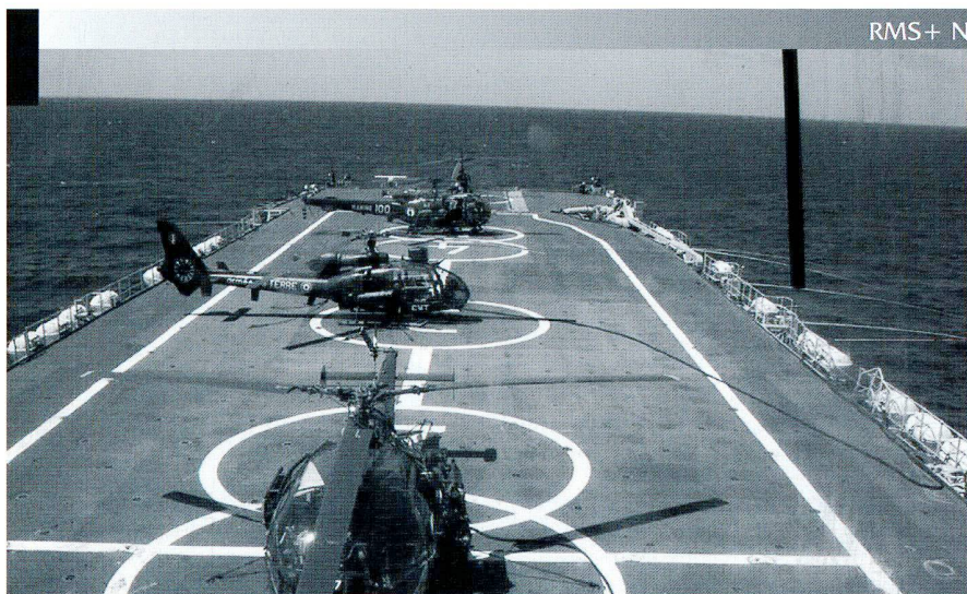
Hélicoptères Gazelle participant à l'opération de libération des otages du Ponant .