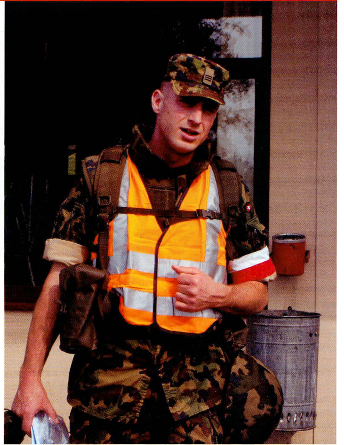
Activité hors service: exercice de tir organisé par le groupement fribourgeois de la SSOLOG.