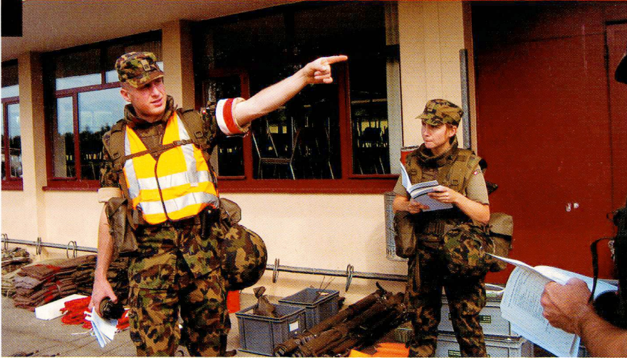
Préparation d'un exercice dans le cadre de la formation continue, une activité hors service exigeante et riche d'enseignements.