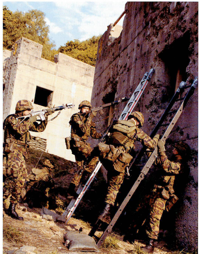
Le combat dans les localités gagne en importance. Il peut être le théâtre de tout le spectre des engagements: de l'infiltration discrète à l'assaut et au bombardement à distance.

Ceci impose naturellement une nouvelle transformation, et une adaptation du modèle actuel. Mais comme les premiers pas d'une telle transformation ont été