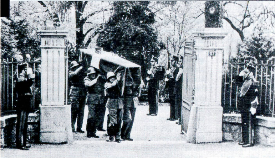
Le cercueil du Général quitte Verte-Rive, porté par des militaires et salué par des gendarmes vaudois.