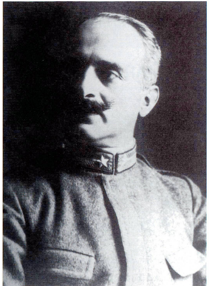
Le Général Giulio Douhet.

Sa pensée se concrétise durant la Grande Guerre pour arriver à pleine maturité en 1921 dans La maîtrise de l'air . Il s'agit d'une vision apocalyptique de la guerre, que jusque-là seuls des auteurs de science-fiction comme Orson Wells ou Jules Verne n'avaient osé décrire. Fortement impressionné par la guerre de tranchées et l'immobilisme des fronts qui ont engendré la mort de millions d'hommes, Giulio Douhet voit dans les nouvelles armes, en particulier l'avion, un moyen de reprendre l'offensive. Incapable de défendre, l'avion ne peut que mener à l'attaque à outrance. Aussi, il trace d'emblée l'utilisation des chasseurs ainsi que de toutes armes de défense aérienne (il ne connaît pas encore les radars et les missiles de défense aérienne, ce qui sera ensuite une des