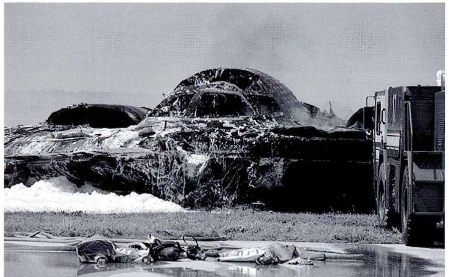
L'épave du Spirit accidenté à Guam.

A 10h29, l'équipage enclenche les radiateurs de bord ; l'eau s'évapore mais les capteurs indiquent désormais une pression trop faible. A 10:30:12, le bombardier commence son décollage sur la piste 06R d'Andersen AFB. L'appareil roule, mais l'ordinateur de bord indique une fausse vitesse relative. Le pilote tire donc sur le manche à une vitesse de 133 nœuds au lieu des 145 requis pour le décollage. 38 secondes plus tard, l'appareil est en perte de vitesse et l'ordinateur de bord prend automatiquement les commandes ; croyant faussement que l'avion pique du nez, le pilote automatique lève le nez de 30 degrés. En stall , le B-2 s'incline sur la gauche et l'aile touche le sol. A ce moment, les deux membres d'équipage s'éjectent. L'appareil s'écrase en bout de piste. Le second appareil, déjà en l'air, reçoit