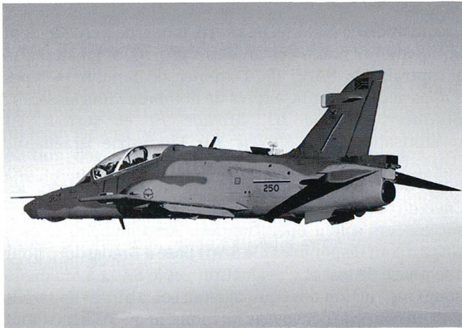
Le Hawk Mk.120 sert désormais de chasseur de première ligne au sein de la SAAF.

Le commandement des forces sud-africaines a donc décidé de recourir à une solution d'intérim. 23 des 24 appareils d'entraînement Hawk Mk120 de fabrication britannique ont été revalorisés et servent désormais de chasseurs dans des scénarios de basse intensité. Dépourvus de radars et incapables de franchir le mur du son, ils ont cependant reçu une avionique adéquate et, capables d'emporter un canon de 30 mm et deux AIM-9 Sidewinder , sont en mesure d'assurer l'interception d'intrus subsoniques. Leur capacité d'emport de 3 tonnes leur permet en outre d'emporter un arsenal air-sol adéquat.