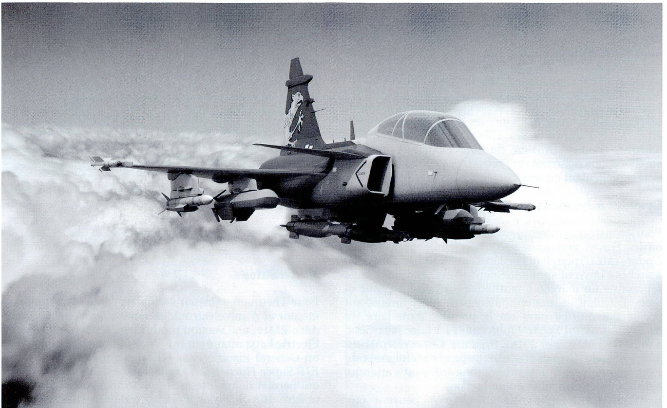
Illustration d'un Gripen NG dans sa configuration air-sol, armé de bombes à guidage laser sous ses deux pylônes ventraux et de missiles de croisière sous voilure. Il emporte, en outre, deux Meteor et deux Iris-T air-air à moyenne et courte portée.