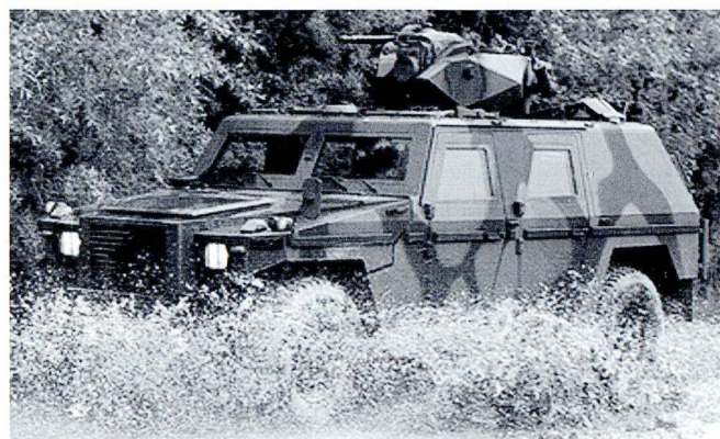
Le Mowag Eagle 4x4 est discret, légèrement blindé et armé.

Les liaisons ne peuvent fonctionner que si les soldats échelon de conduite sont instruits et formés à l'utilisation de ce matériel sophistiqué; cela paraît évident à dire ! Dans la réalité, on doit constater que la technique radio n'est plus rigoureusement maîtrisée ; la plupart des problèmes proviennent d'erreurs de manipulation et d'un manque de connaissances des utilisateurs. Une première conséquence à tirer est de reprendre l'instruction de base au prochain CR à ce niveau, en espérant pouvoir recourir à l'appui de la Formation d'application blindés/artillerie ou à d'autres spécialistes. Une autre conséquence à tirer