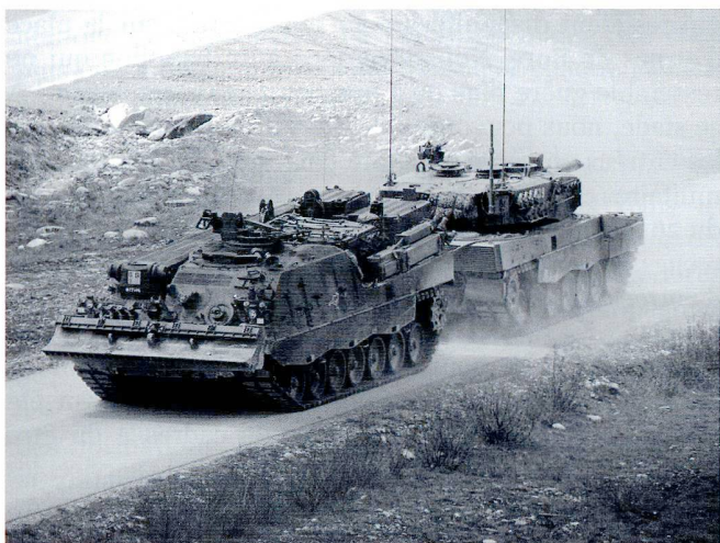
Le Buffel dépanne un char endommagé et l'emmène à l'échelon avancé logistique (EAVL).

nach Nord stossenden Gegner, aus einer von Grenadiere gesicherten Angriffsgrundstellung, mit Kampfpanzern in die Flanke zu fallen, seine infanteristischen Elemente mit Unterstützung des Minenwerferfeuers zu zerschlagen und weiter abzunutzen bzw das Gelände zu säubern. Nach erfülltem Auftrag würde ein weiteres Bataillon durch das Pz Bat hindurch stossen und den Gegner nötigenfalls vernichten. Die Übung, an 2 Tagen durchgeführt, war ein voller Erfolg und gab allen Beteiligten wichtiges Selbstvertrauen. Und natürlich hat das Pz Bat 12 so gründlich aufgeräumt, dass kein zweites Bataillon zum Einsatz kommen musste...!