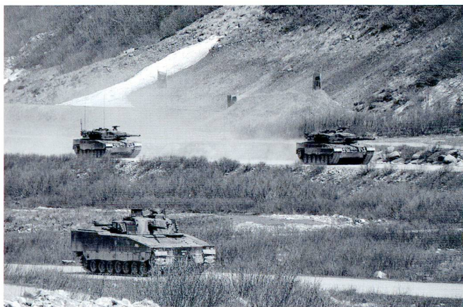
Les chars de combat atteignent la ligne de départ.

nach Nord stossenden Gegner, aus einer von Grenadiere gesicherten Angriffsgrundstellung, mit Kampfpanzern in die Flanke zu fallen, seine infanteristischen Elemente mit Unterstützung des Minenwerferfeuers zu zerschlagen und weiter abzunutzen bzw das Gelände zu säubern. Nach erfülltem Auftrag würde ein weiteres Bataillon durch das Pz Bat hindurch stossen und den Gegner nötigenfalls vernichten. Die Übung, an 2 Tagen durchgeführt, war ein voller Erfolg und gab allen Beteiligten wichtiges Selbstvertrauen. Und natürlich hat das Pz Bat 12 so gründlich aufgeräumt, dass kein zweites Bataillon zum Einsatz kommen musste...!