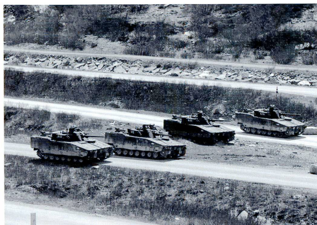
L'avant-garde du bataillon, constitué par une section de grenadiers de chars embarquée, atteint et assure la base d'attaque lors de l'exercice BREACH.

Die grösste Kompanie des Bataillons, die Panzergrenadiere unter Hptm Degen, konnte in Wichlen, Elm und im Cholloch die Gefechtstechnik auf Stufe Patrouille und Zug üben