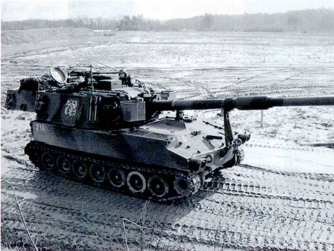
Les groupes d'artillerie peuvent effectuer leurs exercices de tir à Bière VD ou au Simplon VS.

de tir (cdt tir) de la btrr dir feux. Ils ont pour mission de reconnaître l'adversaire et de transmettre l'ordre de feu ou l'information. Les cdt de tir disposent de moyens optroniques (vidéo, laser, imagerie thermique) des plus modernes. À l'engagement, les cdt tir sont attribués aux autres bataillons de la brigade ou, dans le cas des cdt tir AF, sont engagés directement par le chef artillerie de la brigade.