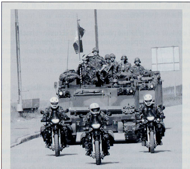
Le cdt bat sap chars 1, le Lt col EMG Jungo, lors du dernier défilé du bat sap chars 1 le 9 juillet 2008, lors de la remise de l'Etendard.

Grade : Lt col EMG Nom : Jungo Prénom : Nicodemo Profession : Officier de carrière