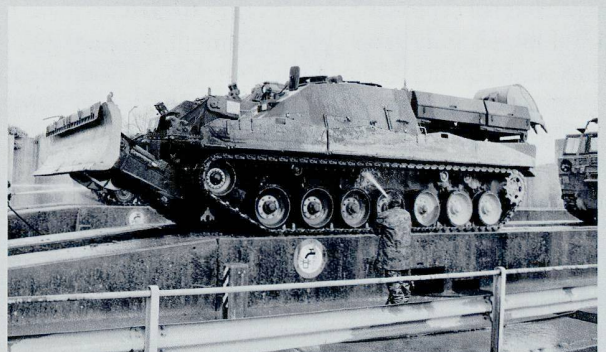
Le char du Génie est en mesure de déblayer tous types d'obstacles sous la protection d'un blindage.