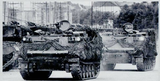
Le char du Génie 63 sert transport au transport des sapeurs.