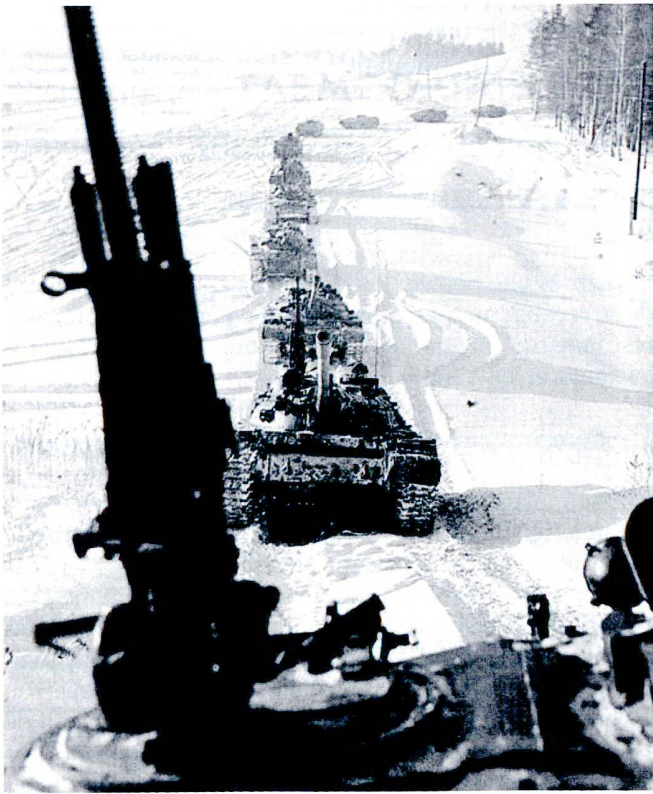
Approche d'une colonne de T-62 lors de manœuvres d'hiver, en URSS.

A l'inverse, une discrétion absolue, un silence pesant après une période de combats peuvent indiquer une attaque imminente. Le secret et la discrétion d'une préparation peuvent garantir la surprise. Ainsi, le 16 décembre 1944, l'offensive allemande des Ardennes a complètement surpris les Américains. Le brouillard, la neige et la couverture boisée ont favorisé la préparation et les débuts de l'attaque.