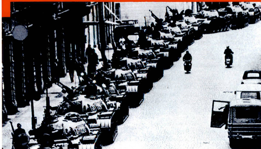
Les préparatifs prennent du temps et les troupes sont alors vulnérables. Ici, une colonne de chars T-55 soviétiques se prépare à entrer dans Budapest en 1956.