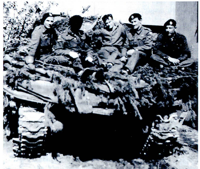
Afin de ménager des pauses, des changements d'échelon sont nécessaires durant l'attaque. Ici, l'équipage d'un Sherman DD du 44th Royal Tank Regiment (RTR) attend l'ordre du départ, en Normandie, 1944.

qui servent tout autant à observer qu'à masquer la ligne principale de résistance. L'utilisation de leurres peut attirer les feux ennemis et diluer ainsi sa force de frappe. En retraite, l'art tient à « dérober une marche » au poursuivant selon les termes des stratèges français du XVIII e siècle, soit déguerpir à la faveur de l'obscurité en faisant croire que l'on continue à camper. Au XX e siècle, la radio permet éventuellement de maintenir une fausse activité. C'est ainsi que la 1 re Division aéroportée britannique décroche du piège d'Arnhem la nuit. Dérouter l'ennemi en le lançant sur un faux itinéraire de retraite est une autre feinte classique.