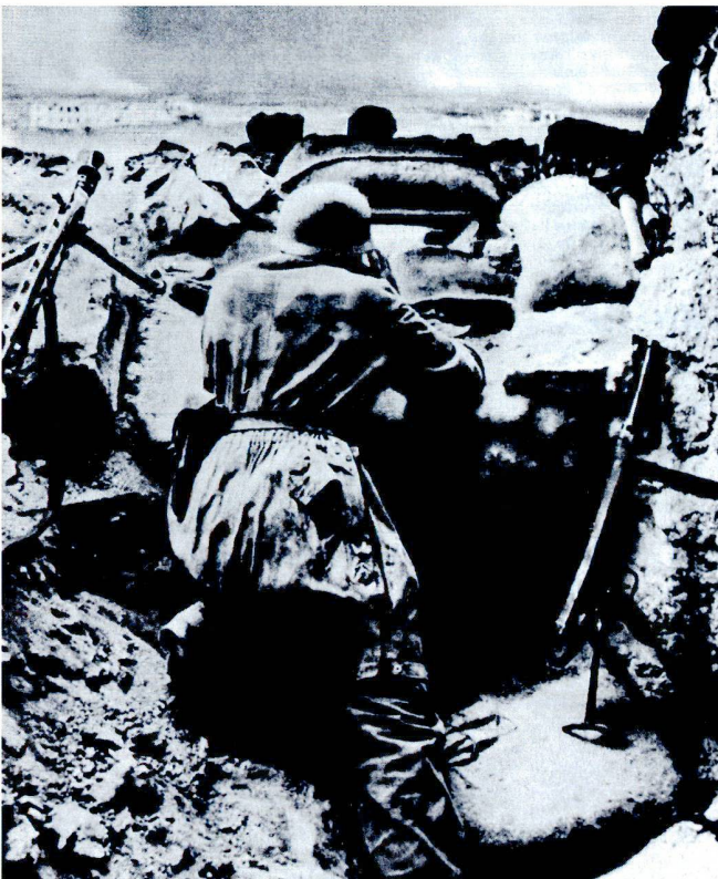
Le passage à la défense nécessite des positions bien choisies, renforcées, ainsi qu'un grand nombre d'armes automatiques et de munitions. Ici, un nid de mitrailleuse à Monte Cassino, 1943.