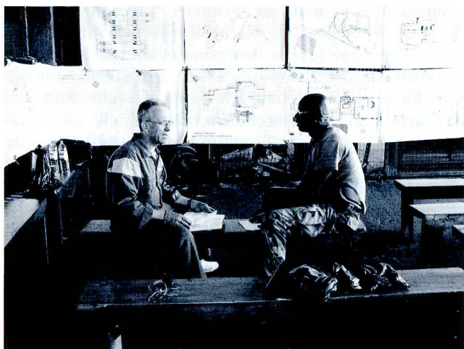
A la demande de l'ONU, le DDPS a remis 260 véhicules militaires (Pinzgauer et Steyr) aux forces armées de Sierra Leone. Deux spécialistes de la BLA ont formé les chauffeurs et les mécaniciens sur place.

différents et qui n'ont que peu, voire pas du tout de caractère intégrateur augmente encore la difficulté.