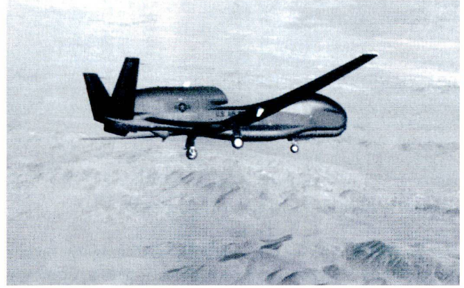
HALE : Le Global Hawk américain est un appareil de reconnaissance stratégique.